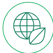
Evaluación Ambiental ·E·