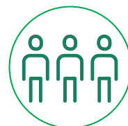
Impacto Social ·S·