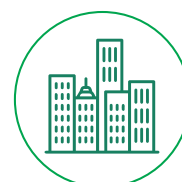
Gobierno Corporativo ·G·

Los factores ESG son determinantes del valor de largo plazo de las inversiones. Su análisis, cuantificación y comparación a través de la Calificación ESG es esencial para la mayoría de los Inversores Institucionales Internacionales.